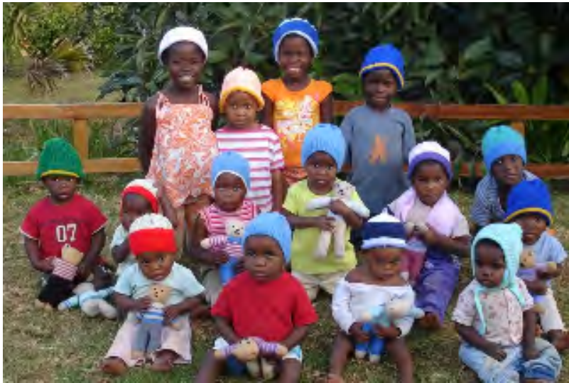
Plant cartref Little Oaks, Limpodo, yng ngogledd Affrica gyda theganau ac yn gwisgo capiau wedi eu gweu gan aelodau Grŵp Help Llaw'r Garn.

Mewn arolwg diweddar o ddwy fil o bobl canfuwyd mai dim ond 37% o bobl y Deyrnas Unedig sy'n credu bod damcaniaeth Darwin am esblygiad i'w derbyn 'heb unrhyw amheuaeth'. Beth, ynteu, mae'r gweddill yn ei gredu? Atebodd 32% eu bod yn derbyn y syniad o 'greadaeth' ( creationism ), sef bod Duw wedi creu'r byd yn ystod y deng mil blwyddyn diwethaf, a bod hanes y creu yn Llyfr Genesis yn ategu hynny. (Gyda llaw, bellach mae 44% o boblogaeth UDA, gwlad fwyaf ddatblygedig y byd, yn credu felly!) Yna, cred dros hanner y boblogaeth yn y syniad o 'fwriad synhwyrol' ( Intelligent Design ), h.y. y syniad nad yw esblygiad ynddo'i hun yn ddigonol ar gyfer egluro strwythurau cymhleth rhai pethau byw, ac felly bod angen ymyrraeth cynllunydd, sef Duw, ar rai adegau tyngedfennol yn y broses.